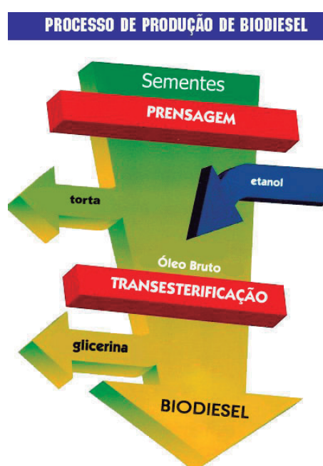
Figura 1 - Processo de produção do Biodiesel.

Sob o enfoque de produção do Biodiesel, na figura 1, é possível observar o processo de produção, bem como todas as suas etapas de preparação e procedimentos até atingir o objetivo final.