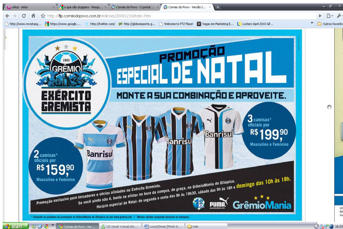
Figura 1 - Anúncio Promocional

Na figura 1, mostra-se como o clube gaúcho utiliza de sua marca junto com outras ferramentas, no caso o exército gremista, para vender seus produtos (Figura 1).