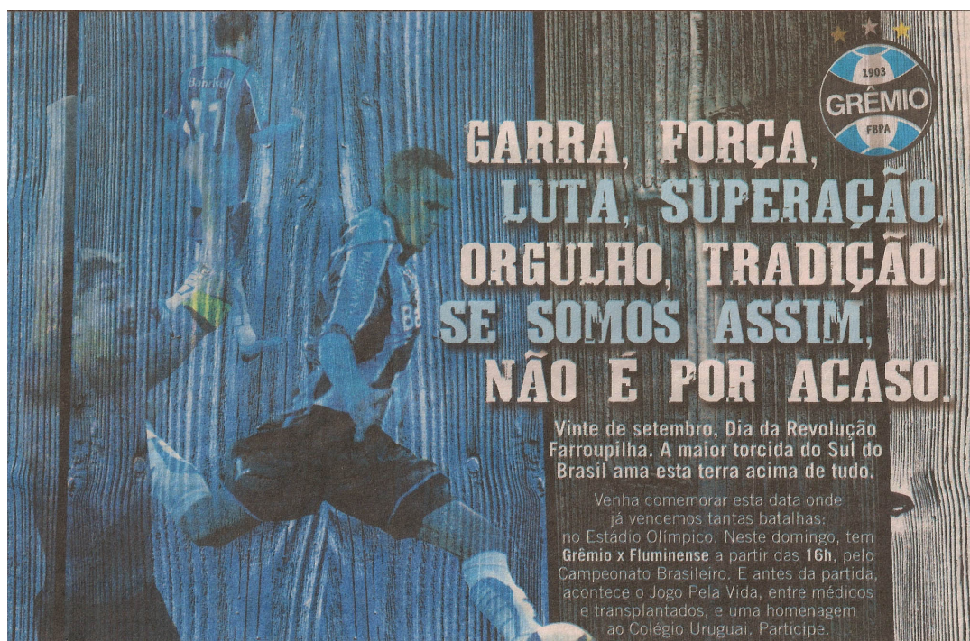
Figura 3 - Anúncio Promocional e Institucional.

Porém, o clube também faz uso da comunicação promocional e institucional em um mesmo anúncio. Na figura 3, percebe-se que ambos os tipos de comunicação analisados nos anúncios anteriores estão presentes no título principal do texto “Garra, força, luta, superação. Se somos assim, não é por acaso.”, desse modo evidencia-se a utilização da comunicação institucional pelo fato de que o clube está afirmando a sua identidade de ser um clube de tradição e superação ao longo dos anos, e transmitindo suas características para o público, assim como afirma Martins (1999). Já a comunicação promocional está presente onde o anúncio convida o torcedor a assistir ao jogo do time contra o Fluminense, pelo Campeonato Brasileiro e comemorar o dia da Revolução Farroupilha uma data de grande importância para o povo do Rio Grande do Sul.