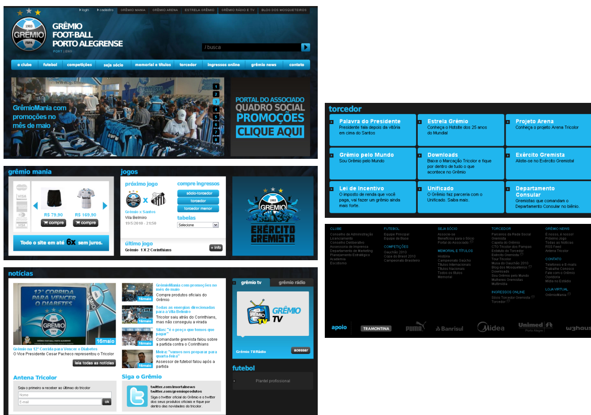
Figura 4 - Site do Grêmio.

A página principal do site é bastante clara e objetiva, pois, segundo Kotler (2003), os clientes ao entrarem em um site querem facilidade na navegação, procedimentos simples e informações objetivas, sem perda de tempo e show de imagens em movimento. Assim como o site do Grêmio, que apresenta estes atributos.