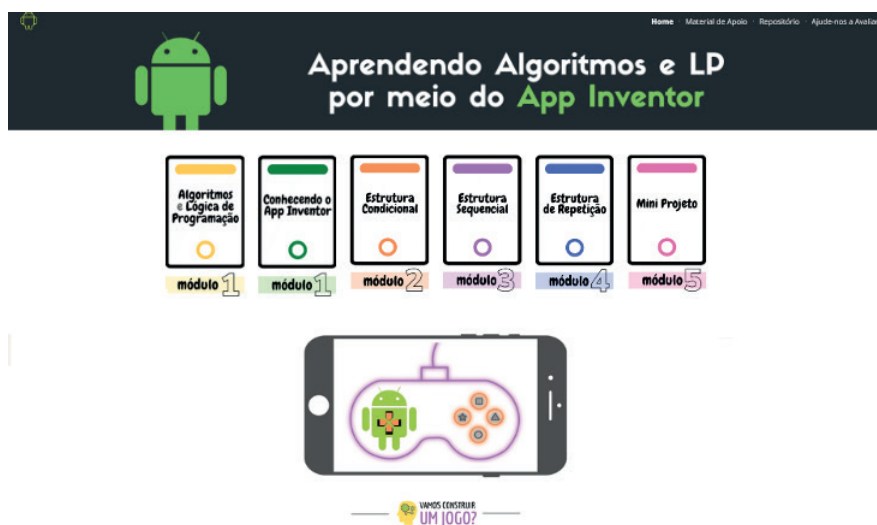
Figura 1 - Tela inicial do site