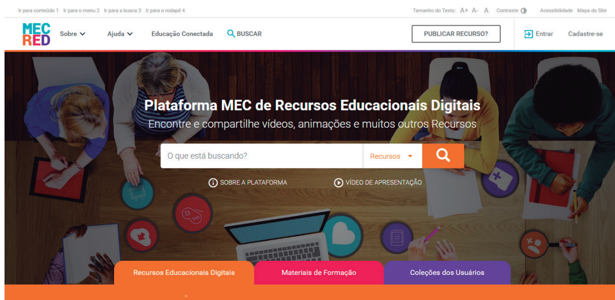
Figura 2 - Página Inicial REDMEC