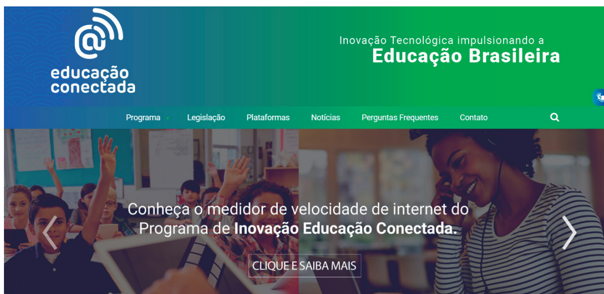
Figura 1 - Página Inicial do Programa Educação Conectada.