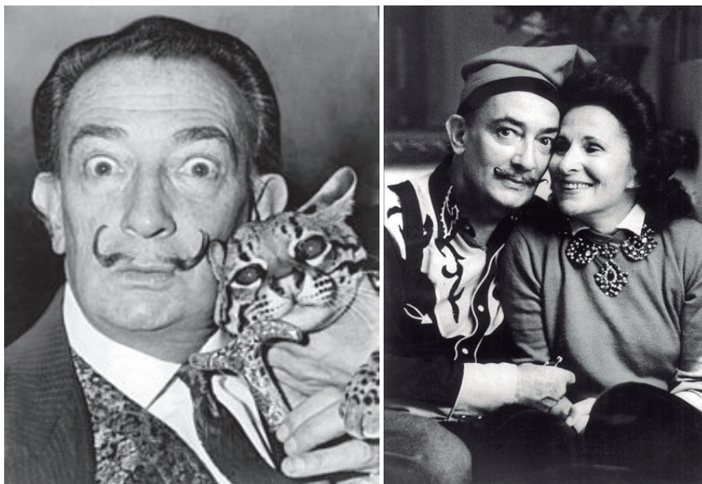
Figura 1 - a) Salvador Dalí e seu gato de estimação, Babou (fotografia de Roger Higgins, em 1968); b) Dalí e sua companheira e musa, Gala.