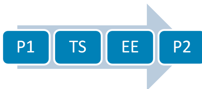
Figura 01 - Esquema, segundo Silveira (1996), da epistemologia de Popper. P1 (Problema de partida); TS (tentativa de resolução); EE (eliminação dos erros) e P2 (novo problema).

O esquema apresentado acima pode ser assim elucidado: P1 - Problema de partida; TS - tentativa de resolução de problema que corresponde à hipótese ou teoria; EE - processo de eliminação do erro através da crítica; P2 - novo problema que emerge. Portanto, boas teorias não apenas resolvem, mas também colocam novos problemas.