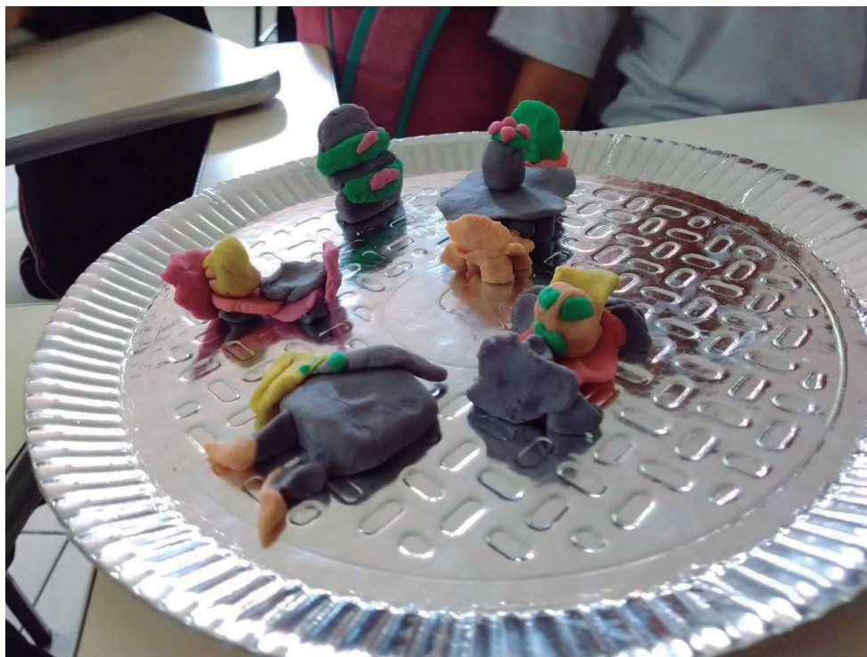
Figura 1 - Excerto TA.P2