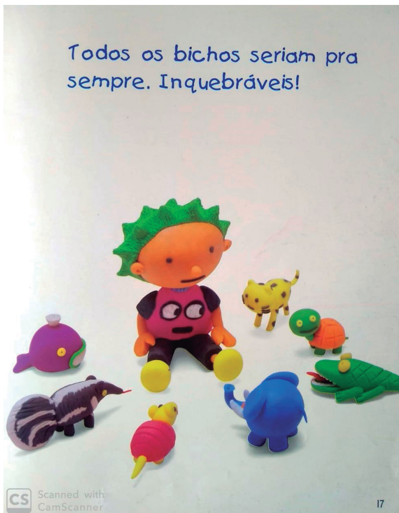
Figura 2 - Imagem do livro “Se Criança Governasse o Mundo”