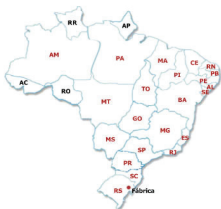
Figura 2 - Mapa do Brasil.